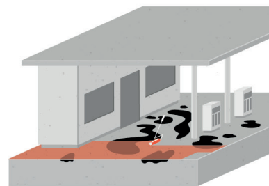
Haftbrücke für verölte Untergründe