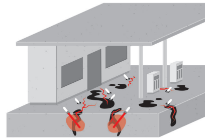
Sanierung von ölkontaminierten Rissen

WEBAC-Chemie GmbH Fahrenberg 22 22885 Barsbüttel Tel. +49 40 67057-0 Fax +49 40 6703227 info@webac.de