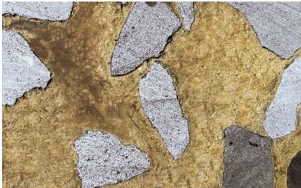
WEBAC® PURseal zur Schotterverfestigung