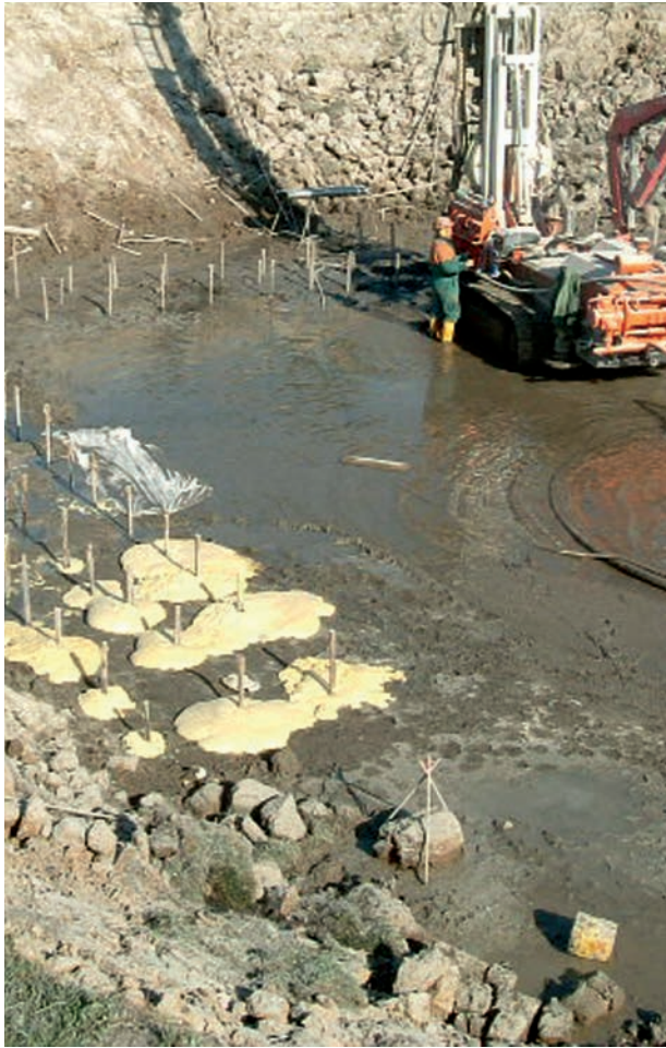
Anwendung von WEBAC Polyurethanschaumharzen

Baugründe, Hanglagen und Erdwälle verlieren ihre Stabilität, Gebäude sacken ab und bekommen Risse.